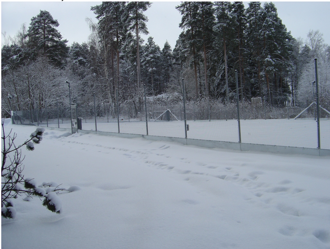
Kuva 3. Geneettisesti muunnellut koivut eristysaitauksessaan Joensuussa helmikuussa 2006. Aidan metallinen alaosa on kokonaan lumen peitossa, eikä suurisilmäinen (2,5 x 2,5 cm) verkko estä pikkunisäkkäiden liikkeitä.

Kasvien geneettinen muuntelu on maailmalla edelleen kokeellinen tekniikka. Geneettisesti muunneltuja viljelykasveja on laajemmassa viljelykäytössä vain kolmessa maailman maassa (USA, Kanada ja Argentiina). Koko maailman maatalousmaasta on gm-kasveilla viljeltynä vain 1,3 % (FAO:n tilastoissa maatalousmaata 5,019 milj.ha, www.isaaa.org sivuilla gm-peltoja 67,7 milj.ha). Geneettisesti muunneltuja metsäpuita ei viljellä vielä missään, ja kenttäkokeitakin on vain muutama. Biotekninen mallipuu on poppeli (Hawkins et al. 2003), jota kasvatetaan laajalti Pohjois-Amerikassa, ja jonka genomi on pieni, vain 4 kertaa Arabidopsiksen genomia suurempi (Joint Genome Institute, Uumajan, Tukholman ja Iowan yliopistot). Koivun kasvatusta on pohjoismainen erikoisuus, joten mitään taloudellisia hyötyjä ei kokeesta ole näkyvissä.